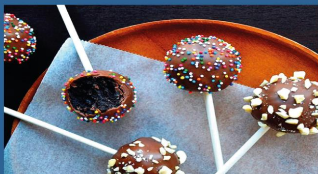
ТРЕНДИ НА СВІТОВОМУ РИНКУ КОНДИТЕРСЬКОЇ ПРОДУКЦІЇ З ЦУКРУ

Тренди на світовому ринку кондитерської продукції з цукру від Офісу з просування експорту.