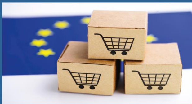
ГАЙД ПО КОРИСТУВАННЮ ACCESS2MARKETS

Access2Markets - це довідковий інструмент на офіційному сайті ЄС, який містить детальну інформацію про законодавчі вимоги до харчової і промислової продукції в ЄС.