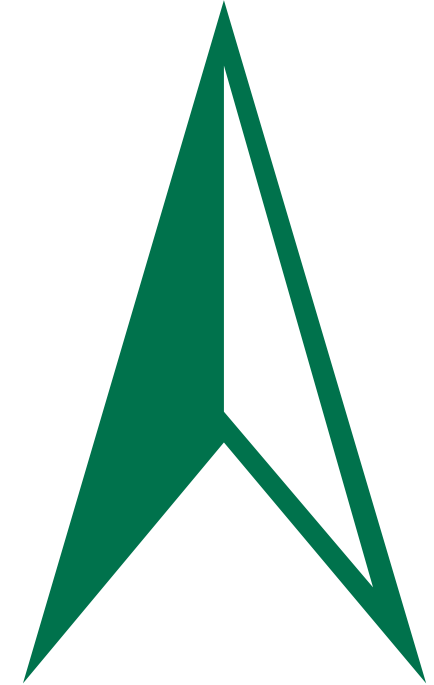
Схема існуючих планувальних обмежень. М 1:5000