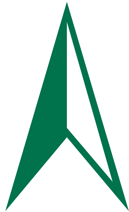
Схема вулично-дорожньої мережі сільського та зовнішнього транспорту. М 1:5000