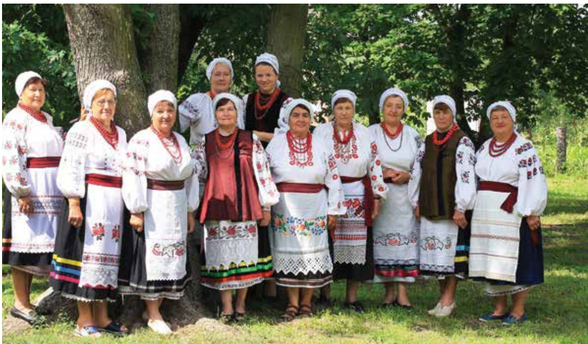
Фольклорний колектив «Червона калина» (Великоолександрівський СБК)