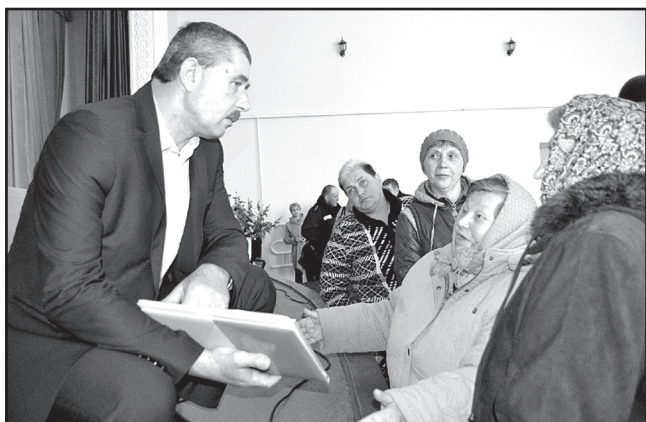
Шановна громадо, земляки, друзі!

Без перебільшення скажу, сьогодні у нас історична подія: вийшов у світ перший номер «Вісник Лосинівської громади» – друкованої газети Лосинівської об'єднаної територіальної громади.