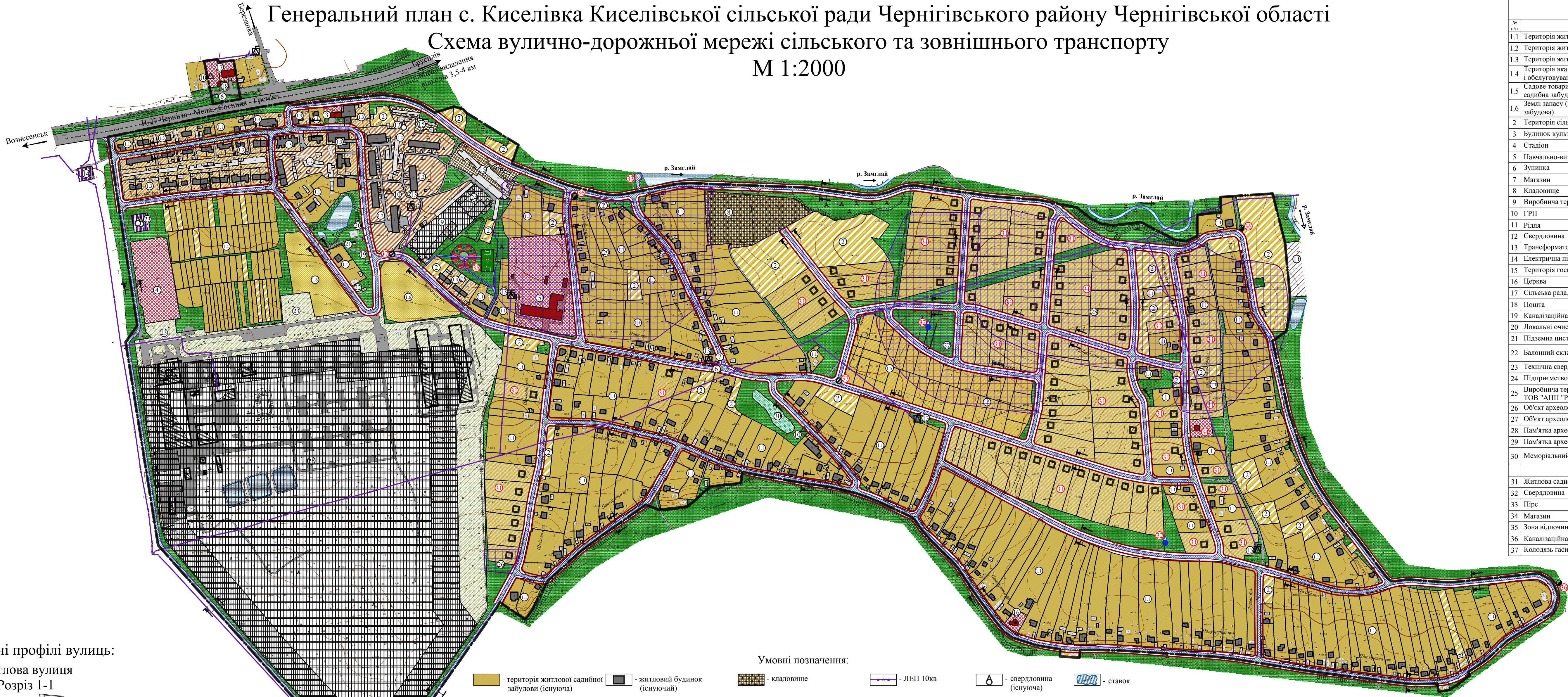
Поперечні профілі вулиць: Житлова вулиця Розріз 1-1