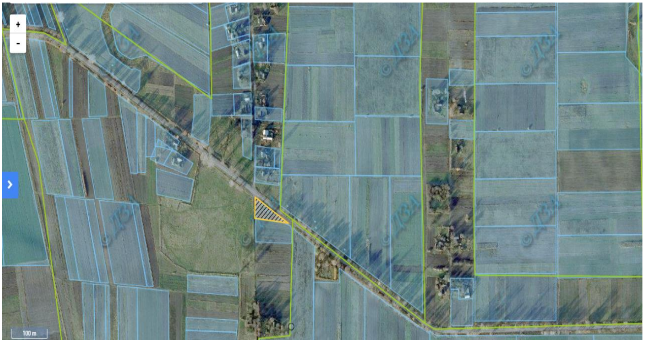
Ділянка 4 площею 0,20