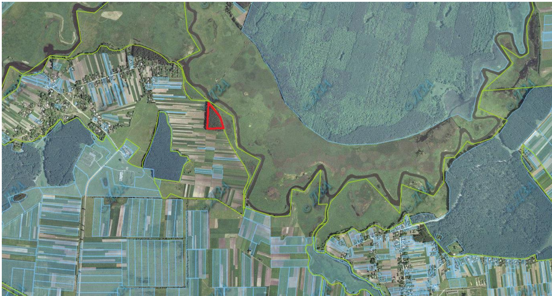
Ділянка №1 (парк в с. Солонів)