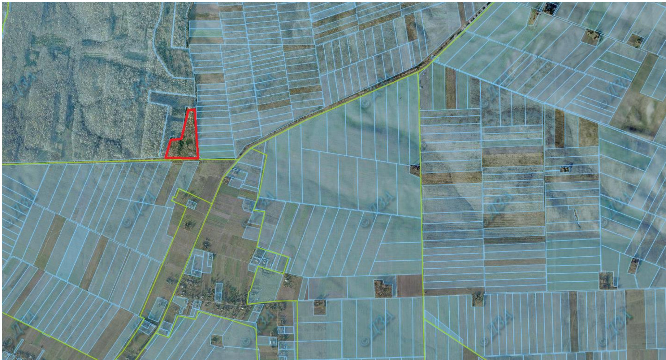
Ділянка №2 (смітник)