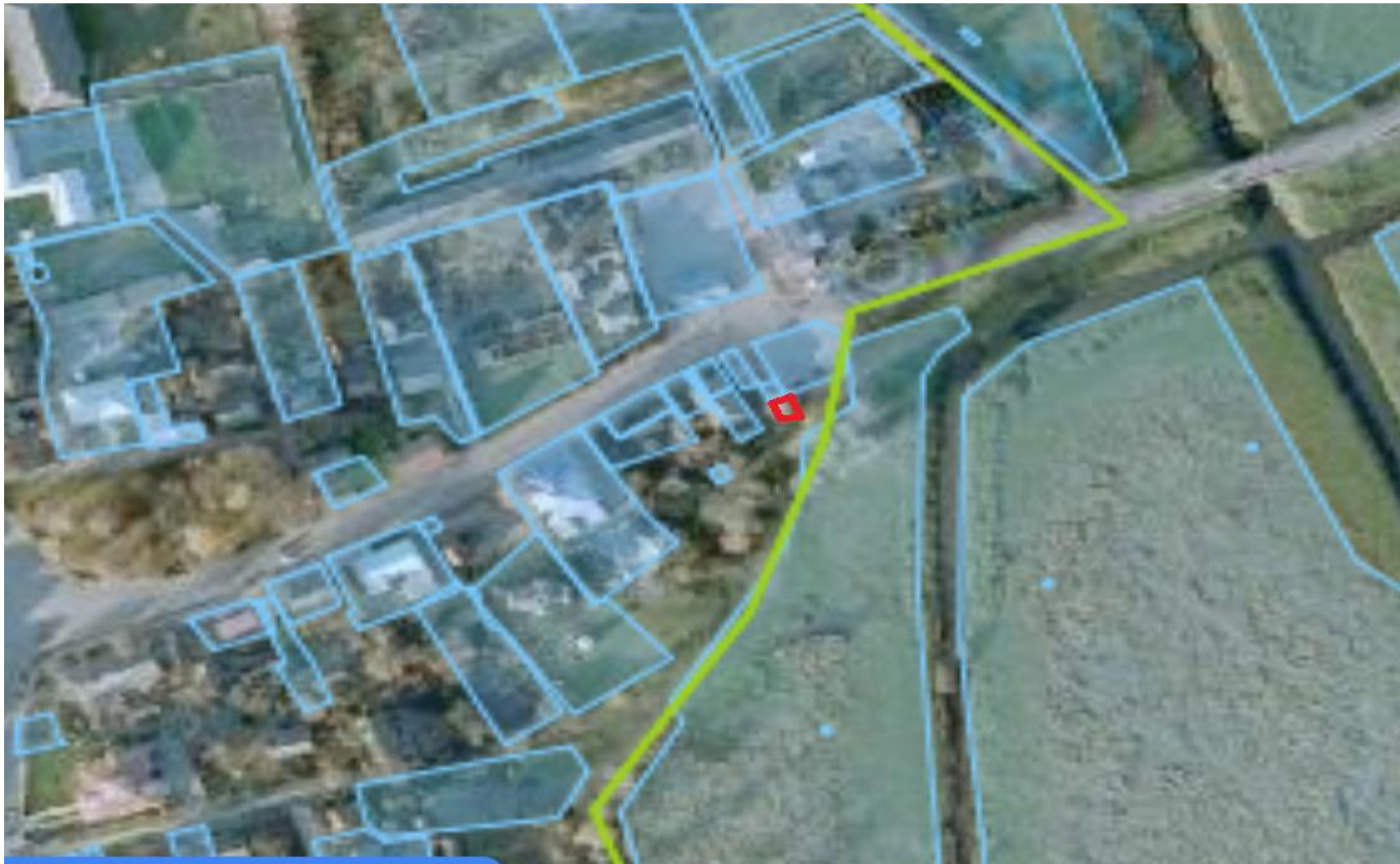
Ділянка №6 (Ткачук)