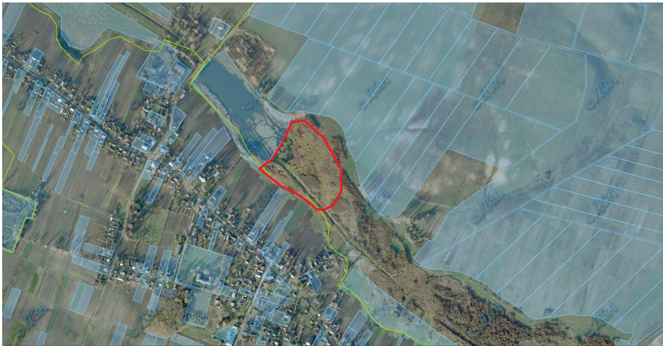
Ділянка №5 (ставок, болото)