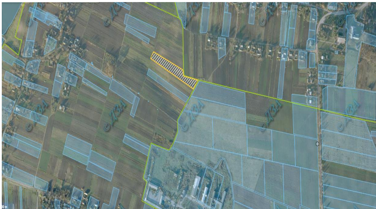
Ділянка 2 площею 0,17 га в с. Рудка