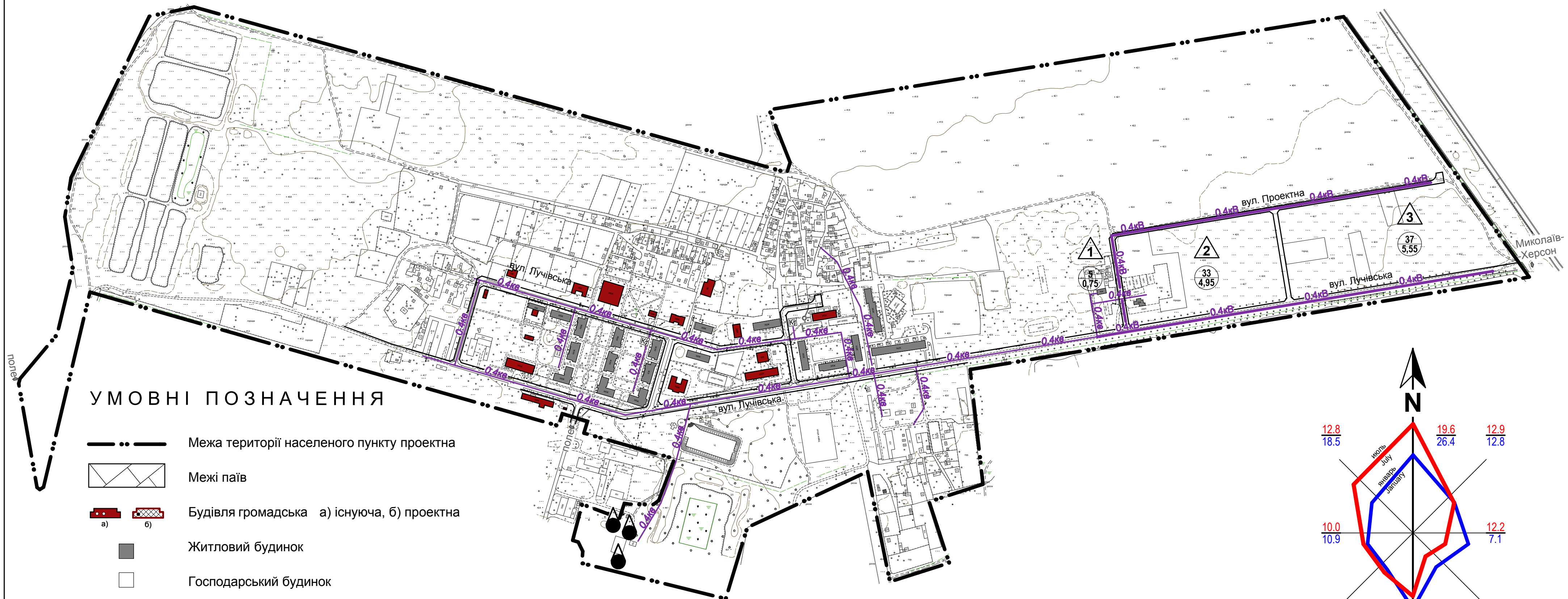
СХЕМА МЕРЕЖІ ЕЛЕКТРОПОСТАЧАННЯ с-ща Луч Вітовського (Жовтневого) району Миколаївської області