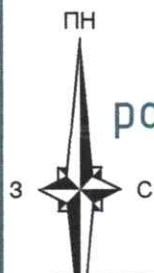
Схема розташування с.Ковганівка в системі розміщення населених пунктів Житомирської області