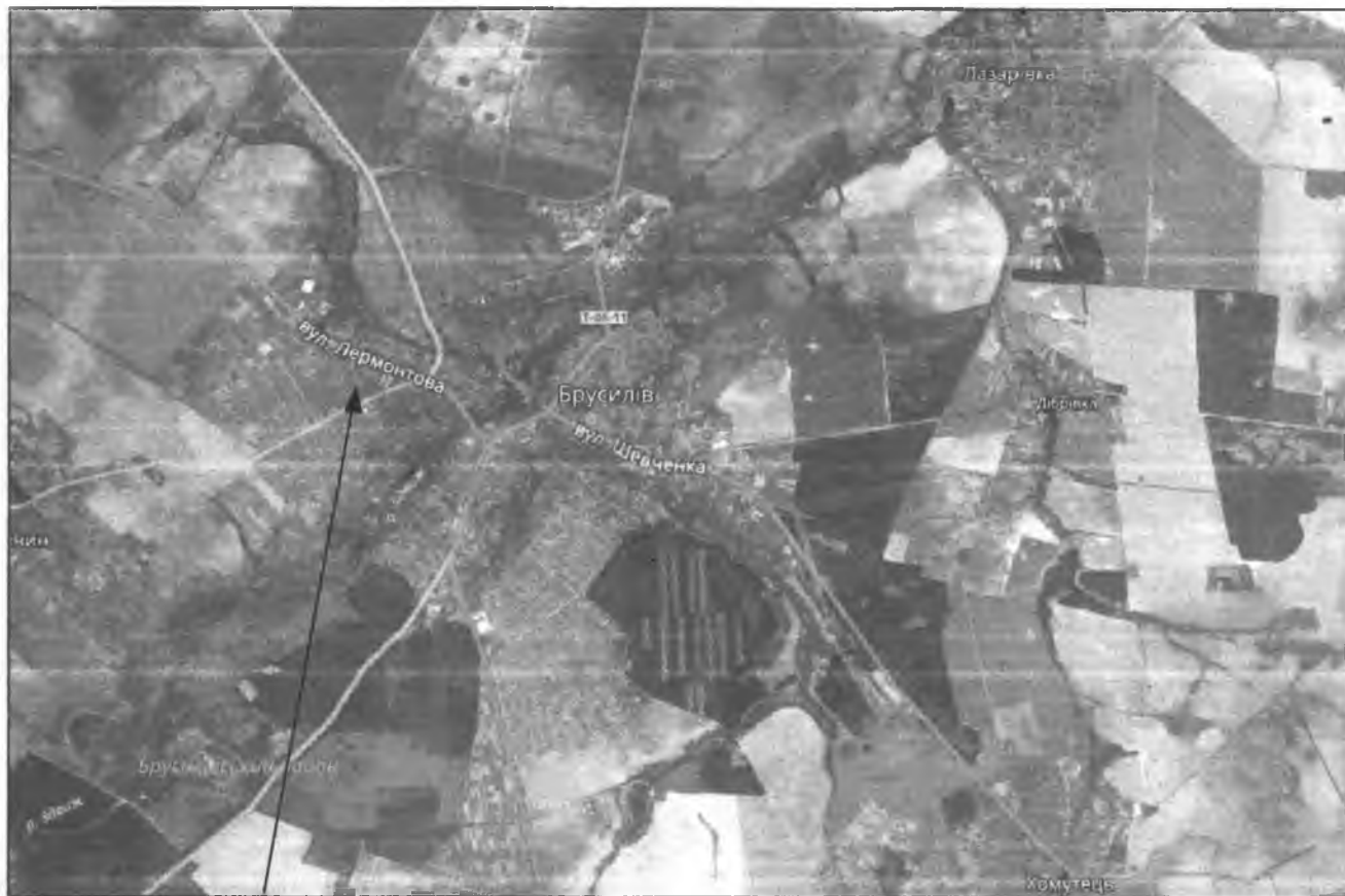
Місце розташування земельної ділянки