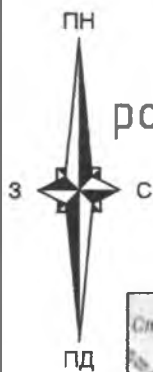
Схема розташування смт.Брусилів в системі розміщення населених пунктів Житомирської області