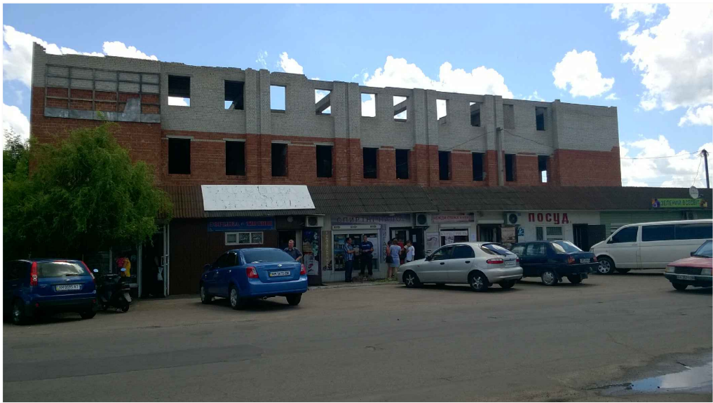
Головний фасад з вул. Митрополита Іларіона