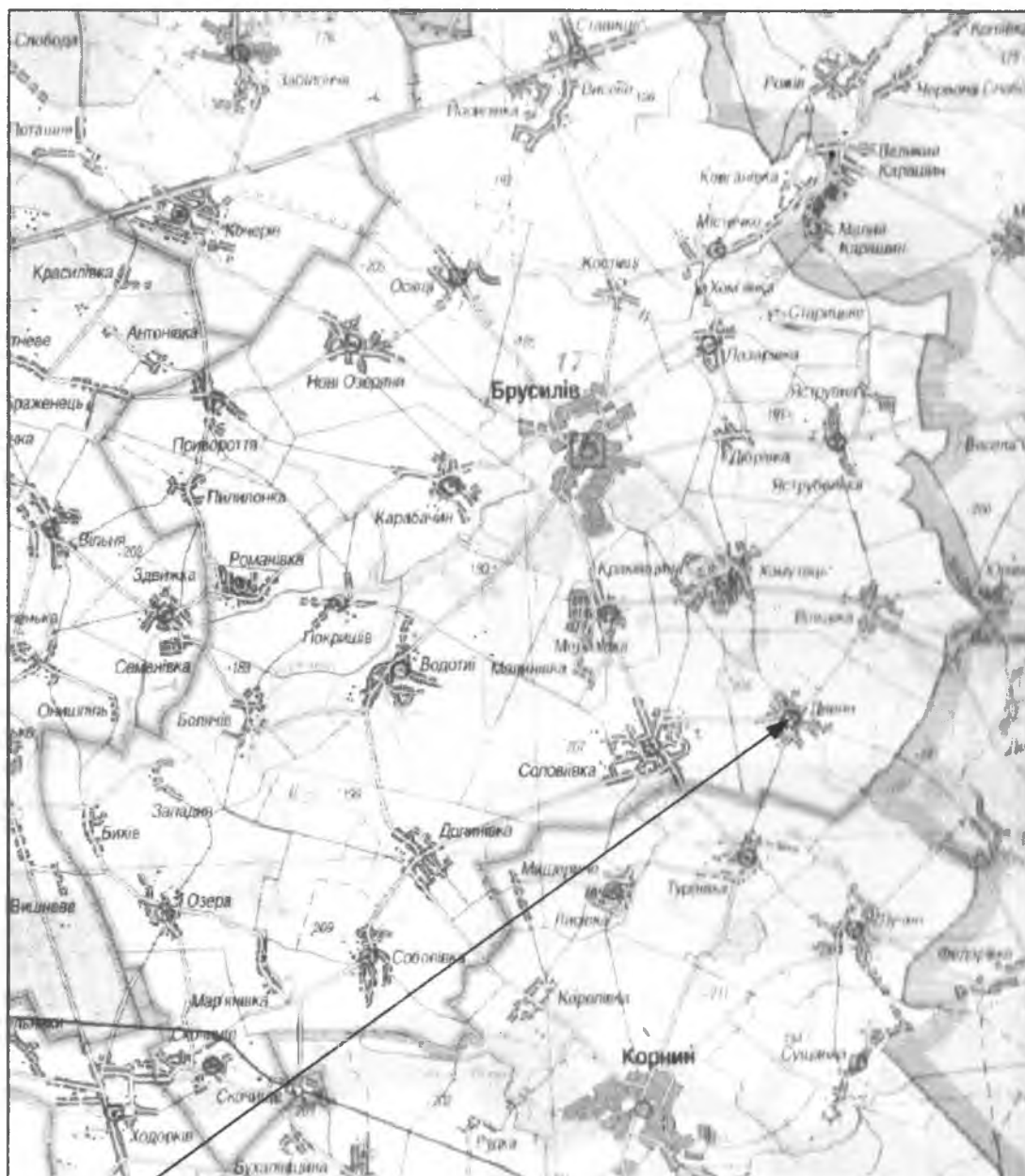
Місце розташування земельної ділянки