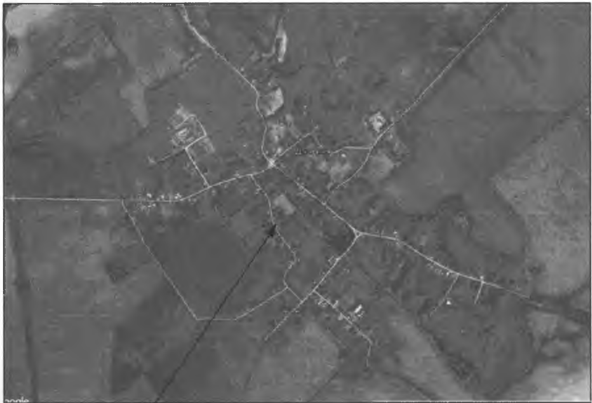
Місце розташування земельної ділянки