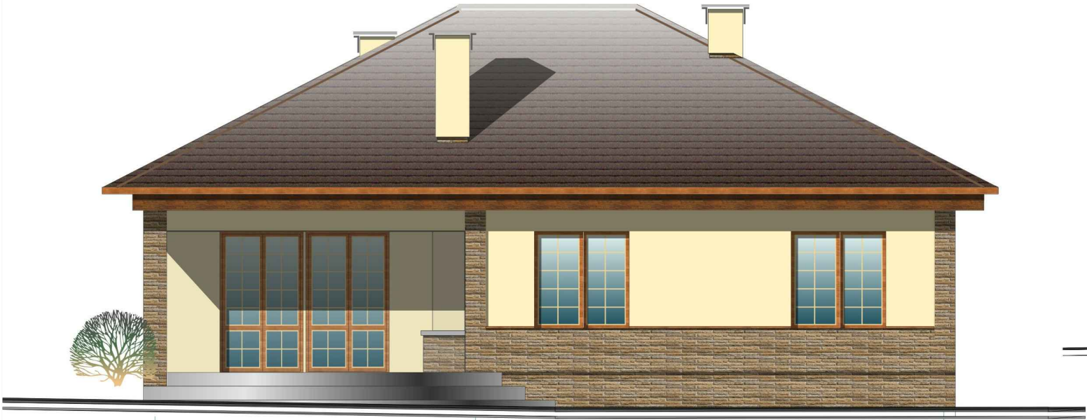
Фасад в осях 5 - 1