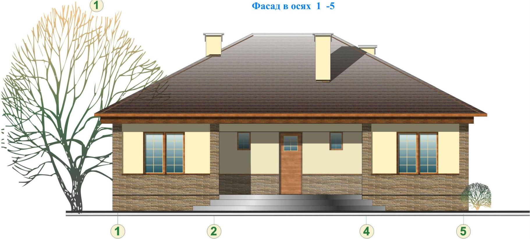
Фасад в осях 1 - 5