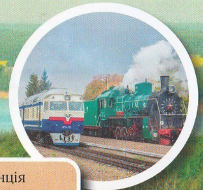
Залізнична станція «Нова Борова»