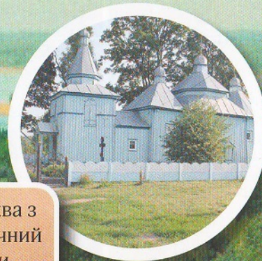
Воздвиженська церква з дзвіницею. Географічний центр Житомирщини (с. Кам'яний Брід)