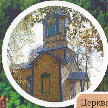
Церква Казанської ікони Божої Матері (с. Фасова)