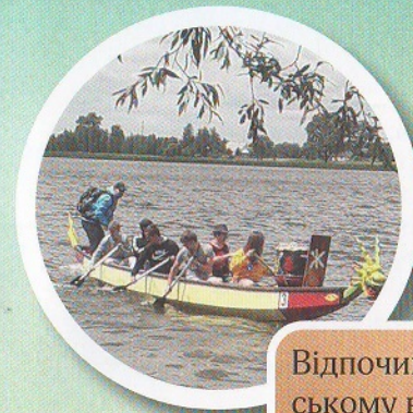
Відпочинок на Іршанському водосховищі