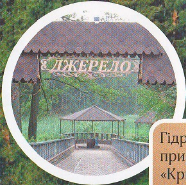
Гідрологічна пам'ятка природи, джерело «Криничка» (с. Старий Бобрик)