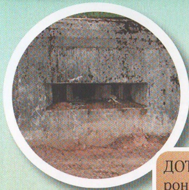
ДОТ (довготривала оборонна точка)

Кількість населених пунктів – 18 (селище Нова Борова, села: Валки, Гацьківка, Ісаківка, Кам'яний Брід, Краснорічка, Кропивня, Луковець, Небіж, Рудня-Гацьківка, Рудня-Фасова, Старий Бобрик, Томашівка, Турчинка, Фасова, Хичів, Ягодинка, Ягодинка Друга). Адміністративний центр – Нова Борова .