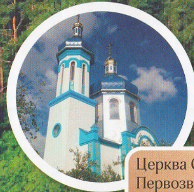
Церква Святого Андрія Первозваного (с-ще Нова Борова)