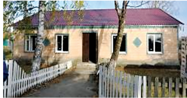
Капітальний ремонт фельдшерського пункту в с. Закусили на суму 648,4 тис. грн. за рахунок коштів державної субвенції на формування інфраструктури ОТГ