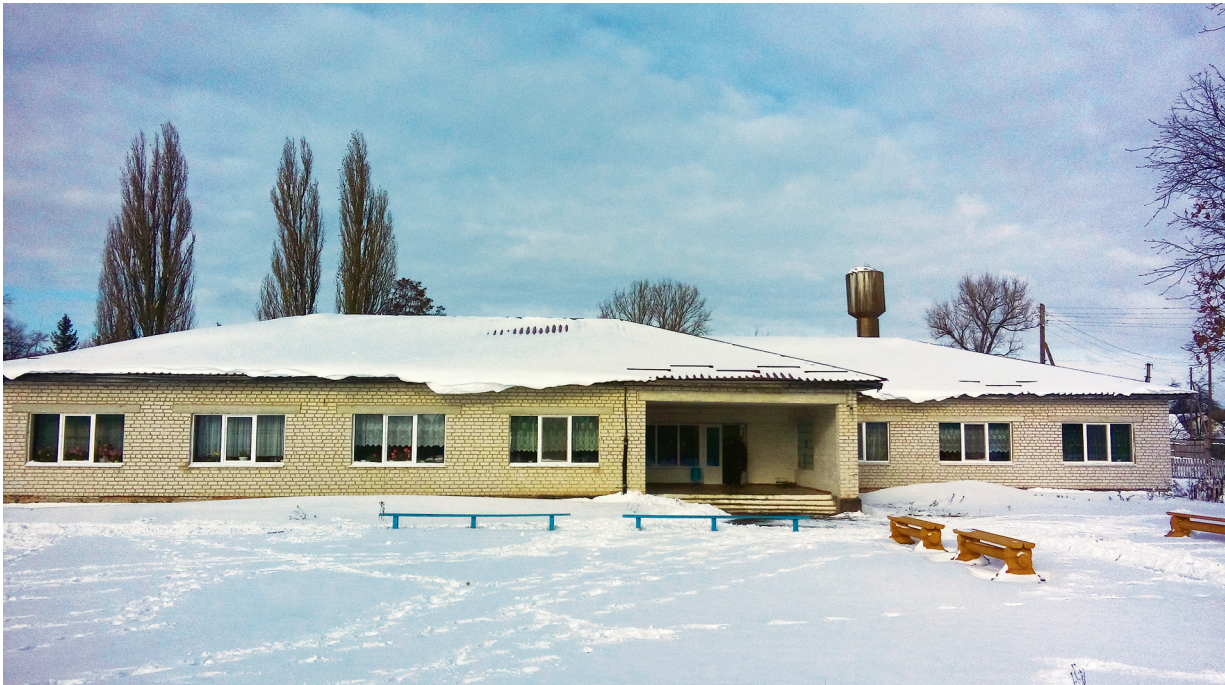
ДНЗ "Веселка" Капітальний ремонт дошкільного навчального закладу в с. Потіївка Радомишльського р-ну 2 750 тис. грн. – субвенція з державного бюджету на формування інфраструктури ОТГ