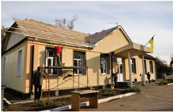
Капітальний ремонт покрівлі будівлі комунальної власності Високівської сільської ради

Кошторисна вартість – 399,966 тис. грн., субвенція з держбюджету – 388,675 тис. грн., бюджет сільської ради – 11,291 тис. грн.