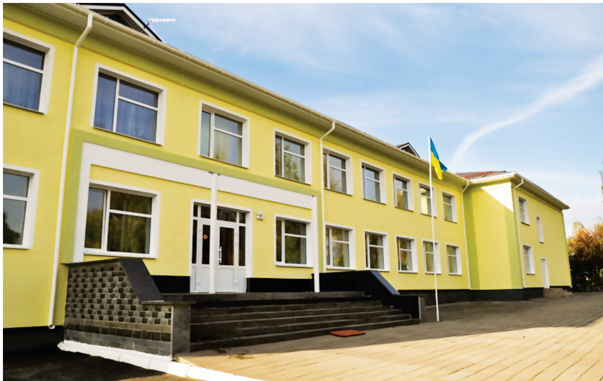
Реконструкція будівлі (теплова санація) Високівської гімназії

загальна кошторисна вартість – 1 197,974 тис. грн., субвенція – 1 189,166 тис. грн., бюджет сільської ради – 8,808 тис. грн.