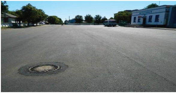
Капітальний ремонт дороги по вулиці Юрченка на суму 633,6 тис. грн. за рахунок коштів державної субвенції на формування інфраструктури ОТГ та субвенції з державного бюджету на соціально-економічний розвиток окремих територій