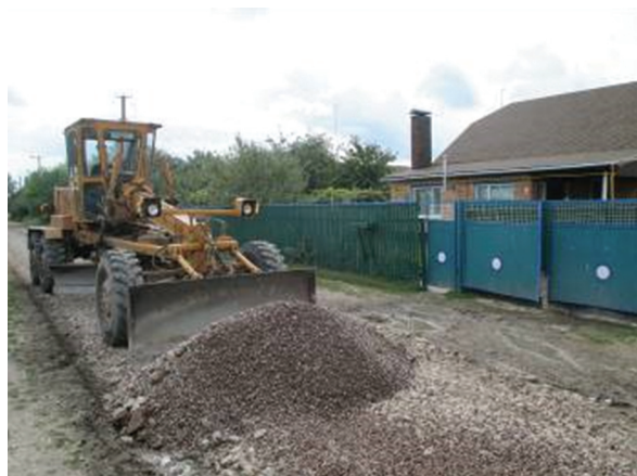
Поточний ремонт дороги по вулиці 8 Березня протяжністю 0,460 км

Обсяг фінансування: 926,0 тис. грн. в т.ч. з державного бюджету 800,0 тис. грн. та місцевого бюджету 126,0 тис. грн.