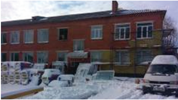
Потіївська ЗОШ I ступеня Капітальний ремонт школи I ступеня в с. Потіївка Радомишльського р-ну 1 345,850 тис. грн. – субвенція з державного бюджету на розвиток інфраструктури ОТГ