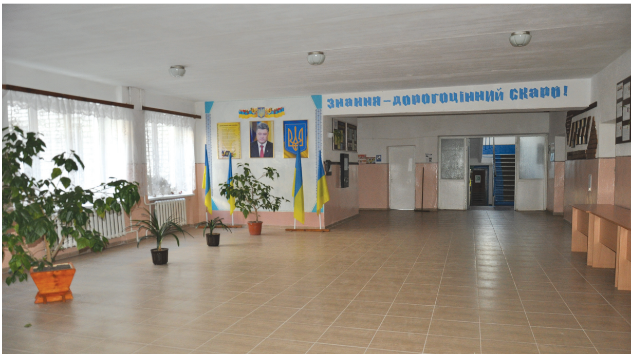
Ремонт приміщення Народицької гімназії на суму 692,4 тис. грн. за рахунок коштів державної субвенції на формування інфраструктури ОТГ