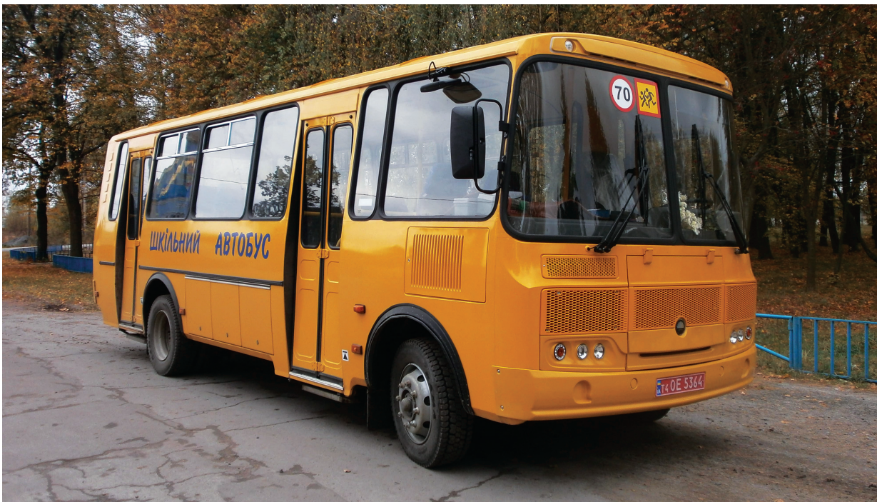
Придбання шкільного автобуса ЗОШ І-ІІІ ст. с. Дубрівка

Загальна вартість – 494,8 тис. грн. Кошти субвенції на формування інфраструктури ОТГ та кошти місцевого бюджету.