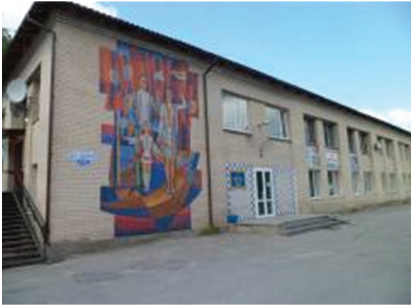
Капітальний ремонт покрівлі (заміна вікон) ЗОШ І-ІІІ ст. с. Мокре

Загальна вартість – 292,6 тис. грн. Кошти субвенції на формування інфраструктури ОТГ