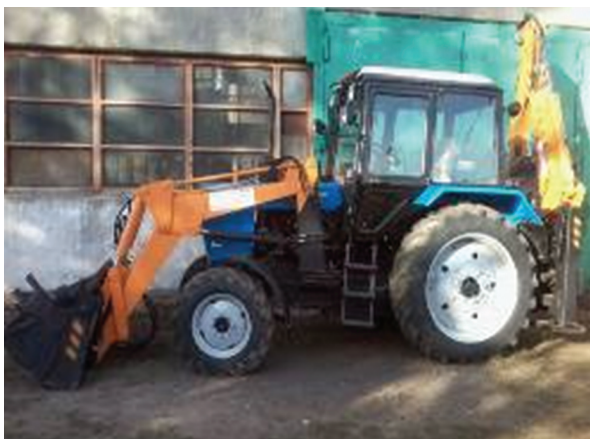
Комунальна спецтехніка Придбання трактора-екскаватора з додатковими змінними комплектуючими

Обсяг фінансування: 926,0 тис. грн. в т.ч. з державного бюджету 800,0 тис. грн. та місцевого бюджету 126,0 тис. грн.