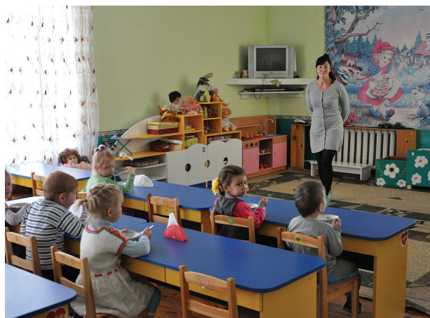
Капітальний ремонт приміщення ДНЗ "Сонечко" смт Народичі на суму 1254,475 тис. грн. за рахунок коштів державної субвенції на формування інфраструктури ОТГ