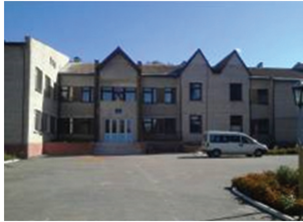
Реконструкція адмінбудівлі (встановлення опалення, облаштування приміщення для ЦНАП) с. Дубрівка

Загальна вартість – 292,6 тис. грн. Кошти субвенції на формування інфраструктури ОТГ