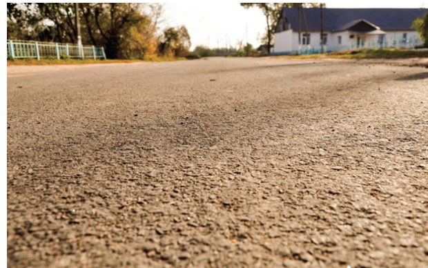
Реконструкція дорожнього покриття

загальна кошторисна вартість – 1 197,974 тис. грн., субвенція – 1 189,166 тис. грн., бюджет сільської ради – 8,808 тис. грн.