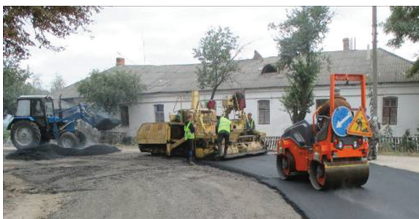
Капітальний ремонт дороги по вулицях Озерній та Терещенка протяжністю 0,340 км в смт Червоне. Капітальний ремонт дорожнього одягу з асфальтним покриттям та ямковий ремонт.

Обсяг фінансування: з місцевого бюджету – 49,793 тис. грн.