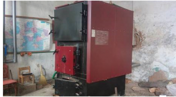
Котельня Потіївської ЗОШ I-III ступенів Капітальний ремонт котельні Потіївської ЗОШ I-III ступенів Радомишльського р-ну з встановленням твердопаливного котла