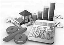
ЗМІНИ, ЯКІ ЧЕКАЮТЬ УКРАЇНЦІВ З 1 ГРУДНЯ