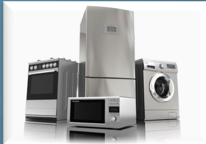
Складна побутова техніка

З 1 січня 2021 обов'язкове застосування РРО