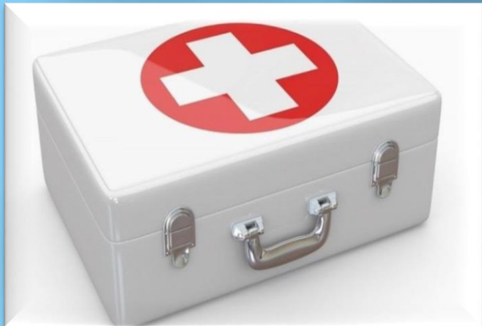
Лікарські та медичні засоби